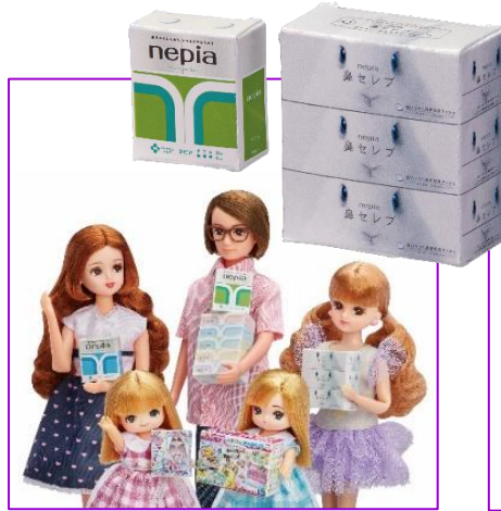
リアルな小物が 100 個付属。王子ネピアとコラボした本物そっくりなアイテムも