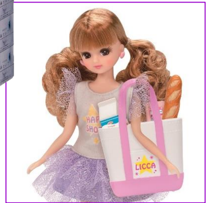
別売りのドレス「ハッピーショッピング」には、レジ袋代わりのショッピングバッグが付属

「リカちゃんイーツ おとどけスクーター」は、子どもたちにもますます身近になった“デリバリー”を、リカちゃんを介して擬似体験できる商品です。付属のご注文パッドでオーダーし、「お届けモード」ではパッドを指して自動的にお届けしてくれます。「運転モード」はパッドの「前進」「バック/左回転」のふたつのボタン操作で自由に好きな所にお届けできます。ボタンが少なくシンプルな操作で、ちいさなお子様でも簡単に遊ぶことができます。