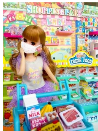
※小物のマスクは「リカペイでピッ！ おかいものパーク」には付属しません。別売りの「ドキドキちょうしんき！ リカちゃん病院」に付属します。

また、「リカペイでピッ！ おかいものパーク」発売を記念し、商品の魅力をYouTube で発信してくださる公式アンバサダーを2020年6月18日（木）からリカちゃんの公式ホームページにて募集します。