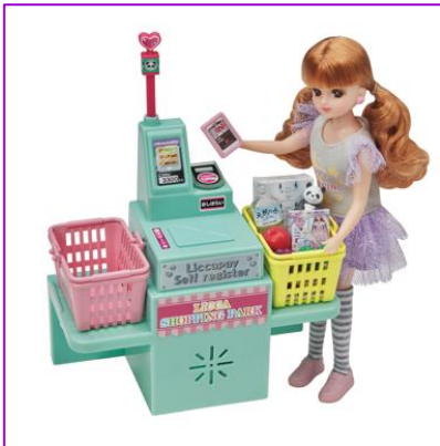
セルフレジで商品を読み取り、キャッシュレス決済

また、お買い物コーデをイメージした別売の人形「ハッピーショッピング」には、レジ袋の代わりになるショッピングバッグが付属します。