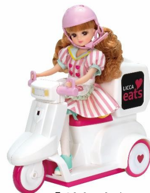
「リカちゃんイーツ おとどけスクーター」 ※人形、ドレス別売り

「リカペイでピッ！ おかいものパーク」や「リカちゃんイーツ おとどけスクーター」は、電子決済やソーシャルディスタンスをはじめ、7月1日から導入されるレジ袋の有料化や、益々身近になっているデリバリーサービスの利用など、これからの生活に必要な習慣や新しい生活様式を、おうちの中で親子一緒に楽しく遊びながら疑似体験できます。