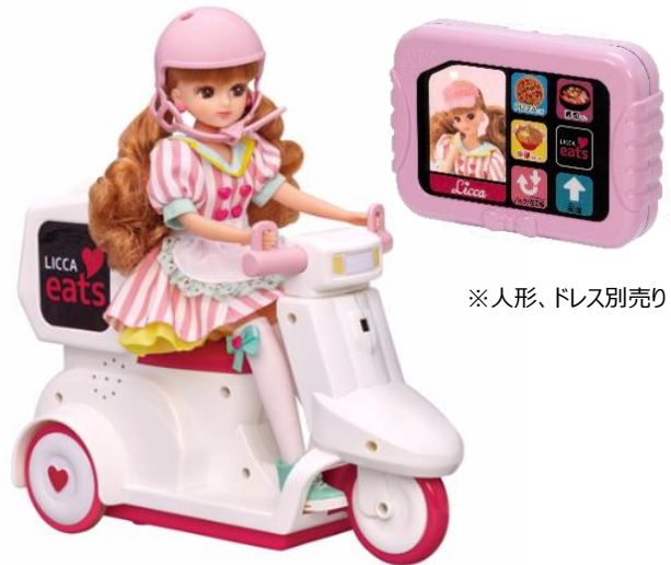
※人形、ドレス別売り

「リカちゃんイーツ おとどけスクーター」は、子どもたちにもますます身近になった“デリバリー”を、リカちゃんを介して擬似体験できる商品です。付属のご注文パッドでオーダーし、「お届けモード」ではパッドを指して自動的にお届けしてくれます。「運転モード」はパッドの「前進」「バック/左回転」のふたつのボタン操作で自由に好きな所にお届けできます。ボタンが少なくシンプルな操作で、ちいさなお子様でも簡単に遊ぶことができます。