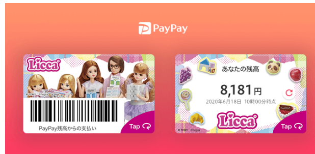
「リカちゃん みんなでおかいもの♪」きせかえデザイン

「リカペイでピッ！ おかいものパーク」の発売を記念し、スマホ決済アプリ「PayPay」の「カードきせかえ」にリカちゃんコラボのデザイン2種類が登場します。きせかえ期間は2020年6月18日(木)～2020年12月31日(木)で、無料でご使用いただけます。