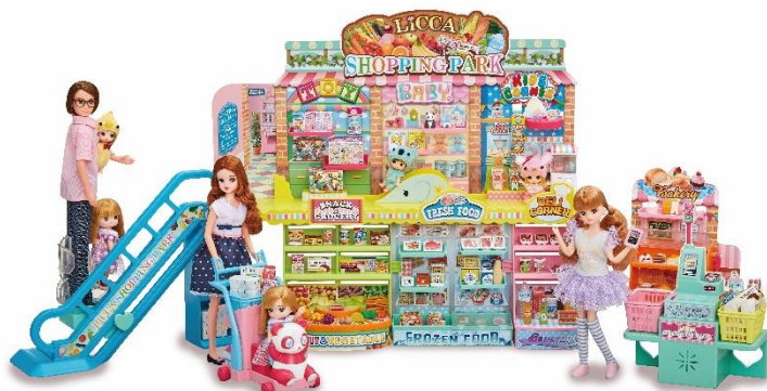
「リカペイでピッ！ おかいものパーク」 ※人形、ドレス、バンダカート別売り （右）リカちゃんが一人でおつかいをしている様子。

株式会社タカラトミー（代表取締役社長：小島一洋／所在地：東京都葛飾区）は、着せ替え人形「リカちゃん」シリーズのショッピングモール「リカペイでピッ！ おかいものパーク」（希望小売価格：6,980円／税抜き）を2020年6月20日（土）から、デリバリー遊びが楽しめるRC「リカちゃんイーツ おとどけスクーター」（希望小売価格：5,300円／税抜き）を2020年7月4日（土）から、全国の玩具専門店、百貨店・量販店の玩具売り場、インターネットショップ、タカラトミー公式ショッピングサイト「タカラトミーモール」（ takaratomy.com ）等にて発売します。